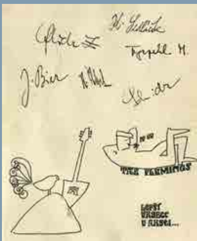
Novoročenka skupiny Flemings z Ostrova nad Ohří

Letmý a hrubě neúplný výčet jmen hrdinů rock'n'rollové fronty těch let: v Ašském výběžku operovali krom přeživších průkopníků Amigos ještě LHP, na jejichž produkce vzpomínají