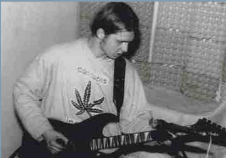
Svobodný Slovo, Sokolov, 1989