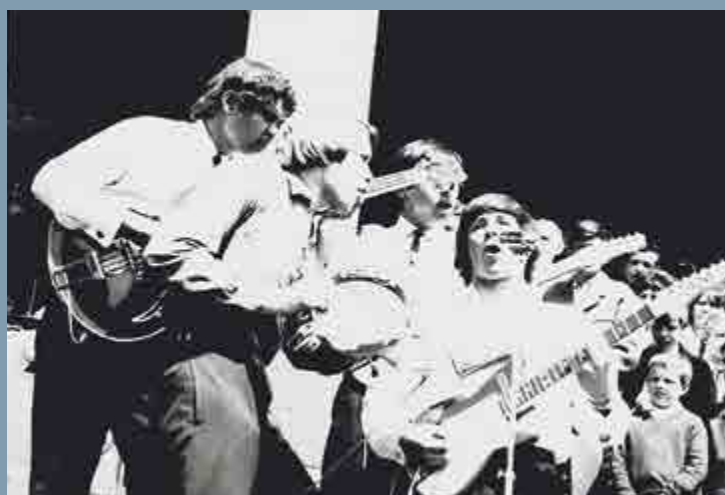
Sokolovské Želvy na schodech zdejšího Hornického domu, 1966.