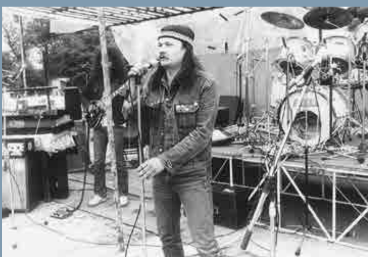
Bahno, Karlovy Vary.