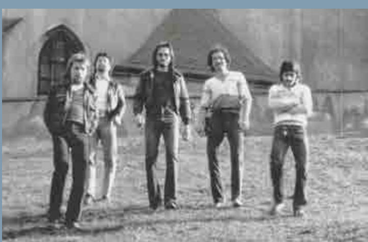
Fortuna, Cheb, počátek 80. let