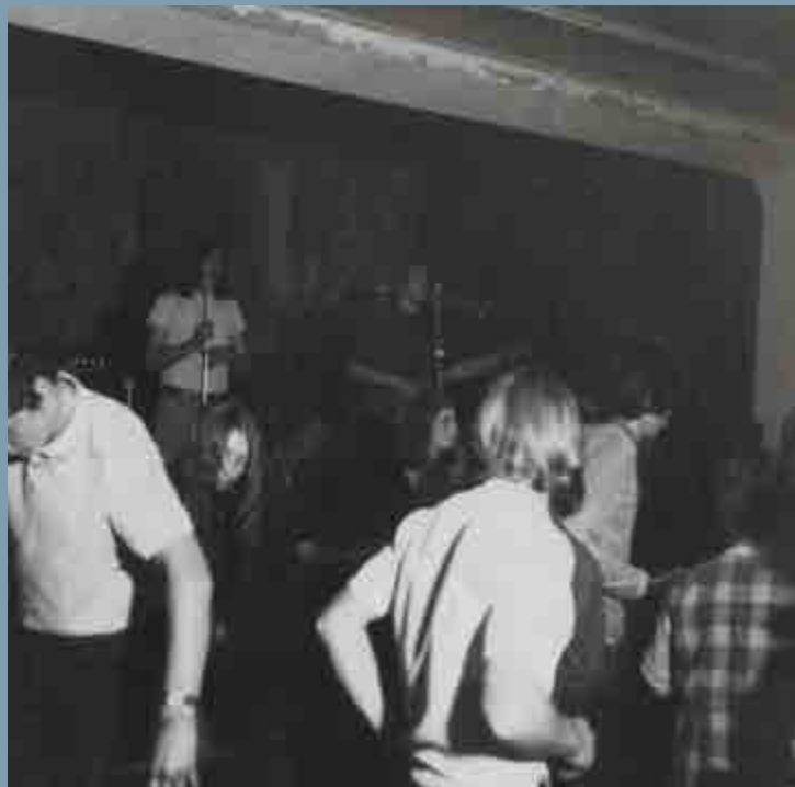
Crash Club v Nejdku, a jeho domácí band, 1969

pamětníci s pohnutím. Na pionýrské počiny chebských skupin šedesátých let (Sconce, Expanze, Hitmakers, Golden Birds) navázal Retox nebo Medium, s několika důležitými postavami následujících let. Na Sokolovsku se ke skupinám s kořeny v hloubi předchozí dekády (Želvy, Lucie) připojila nová jména: Smog, Modul, Formace, KontaktNa sklonku dekády se na zdejší scéně objevuje Triton a Radikál, jehož členové budou hrát důležitou roli v následujících dvou desetiletích. V Chodově působila Sutana, v Karlových Varech například Federativ, Proměny (v prvních dvou letech existence Natural), Perspektivum, Spektrum, Akvarel a v druhé polovině dekády Atomic. V Nejdku navázala skupina Var na odkaz, který zde na sklonku let šedesátých zanechali The Crash.