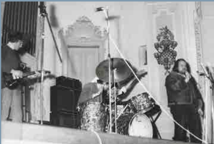
Památný festival Zlatý kamzík v karlovarském Puppku, 1970 (skupina na snímku je pravděpodobně Bier Band z Ostrova nad Ohří)