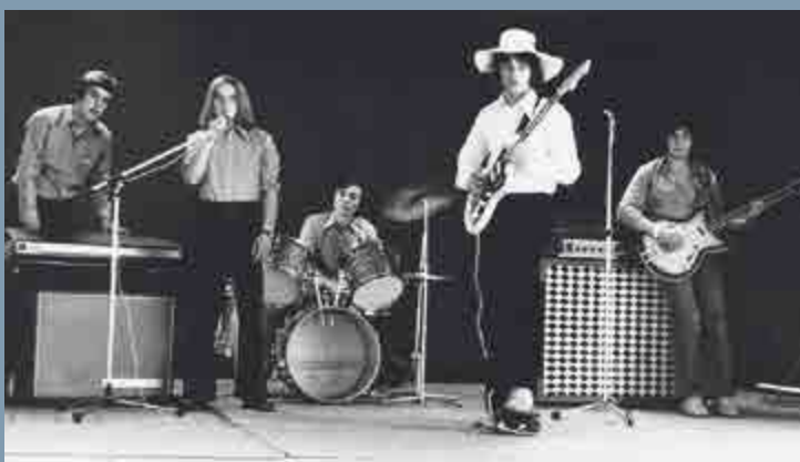
Federativ, Karlovy Vary, počátek 70. let.