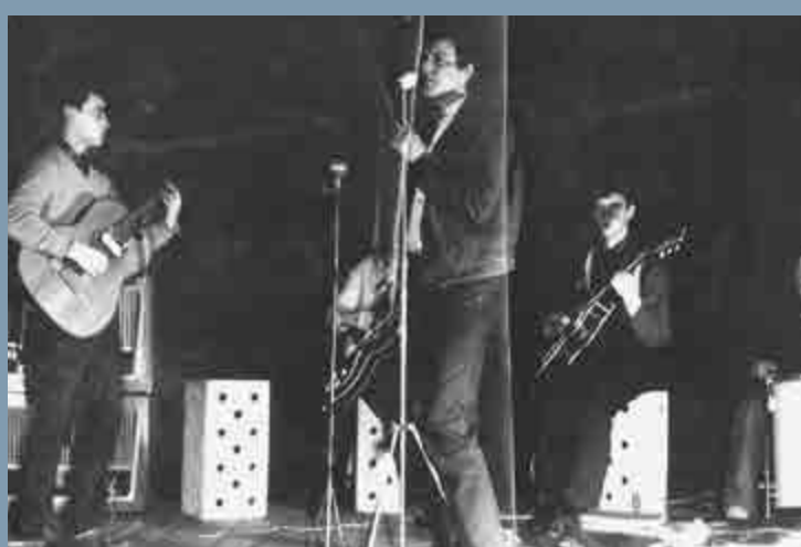
Black Beat, jedno z těch opravdu prvních karlovarských zjevení, cca 1963.