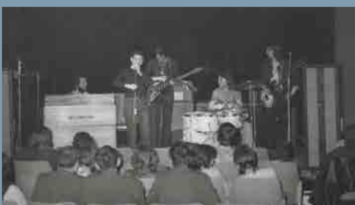
Jedna z mnoha sestav karlovarských Proměn.