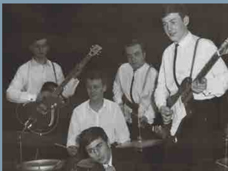
The Sconce, 1966.