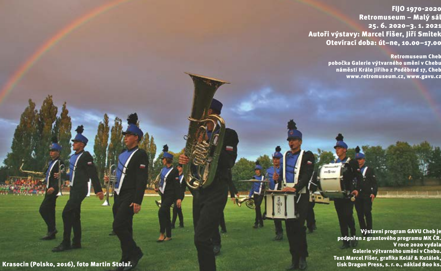
Krasocin (Polsko, 2016), foto Martin Stolař.

Retromuseum Cheb pobočka Galerie výtvarného umění v Chebu náměstí Krále Jiřího z Poděbrad 47, Cheb www.retromuseum.cz, www.gavu.cz