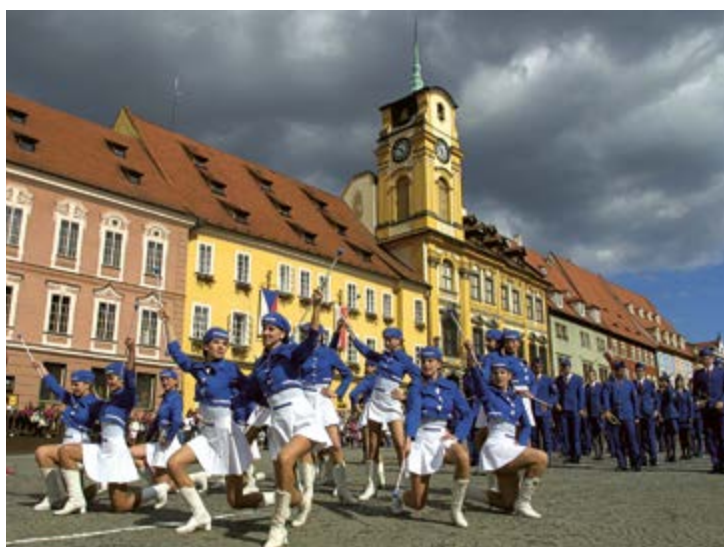
Chebské mažoretky, 2002, foto Martin Stolař.