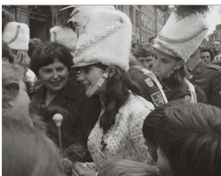
Francouzské mažoretky ze Saint-Pol-sur-Mer, 1970.