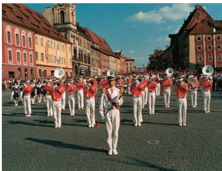
Takaoka (Japonsko), 1989.