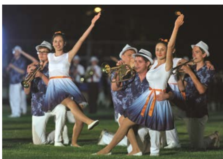
Show chebského orchestru a mažoretek (2016).

prostor a v roce 1989 už měly téměř všechny zúčastněné orchestry vlastní mažoretkovou sekci. Poslední výrazný trend festivalu představují vystoupení showbandů. První vlaštovkou bylo zmíněné vystoupení japonského souboru v roce 1989, na které v roce 2000 navázal chebský orchestr. Se svým programem hned po festivalu zamířil na svůj první zájezd mimo Evropu do kanadského Calgary, kde probíhala světová soutěž World Association of Marching Show Bands. Zde zvítězil ve své kategorii a následně byl do této organizace i přijat. Od roku 2010 se přehlídky mažoretkových souborů a showbandů staly pravidelnou součástí festivalu. Od roku 2016 showbandy soutěží o cenu hejtmana Karlovarského kraje.