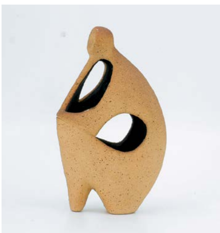
Sedící, č. 62/61, autor Antonín Škoda, v. 23 cm, šamot

V průběhu 60. let byly mimoto zavedeny dvě technologické novinky. Tou první bylo využití skla: skleněná drť se vkládala na kameninu, jež se vypalovala za vysokých teplot. Tímto postupem vznikaly originální předměty se skleněnou vrstvou – například závěsné kachle či soubory váz. Druhou metodou bylo míchání kameniny s kysličníky kovů, kdy vypálením vznikala nádherný tmavý probarvený střepek, který se dále zdobil tmavým burelem.