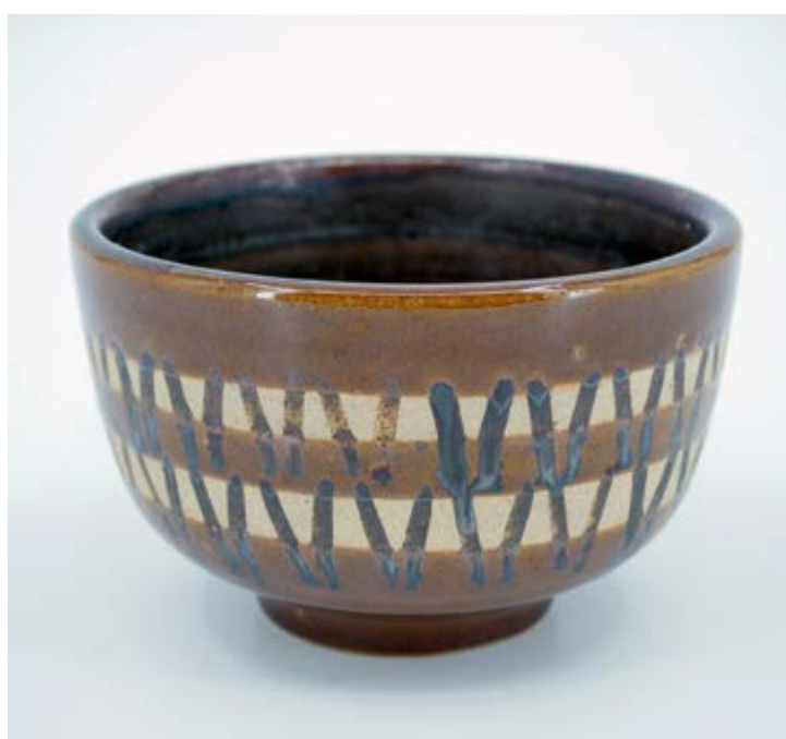
Miska, č. 62/106, autor Antonín Škoda, prům. 15 cm, plavená kameninová hmota