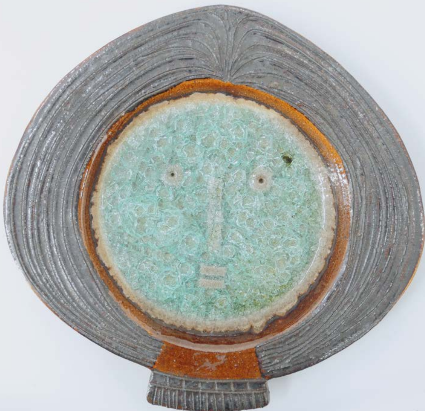
Děvče, č. 66/29, závěsný kachel, autor Antonín Škoda, prům. 27 cm, zatáčeno z hrnčířské hlíny, dekor sklo