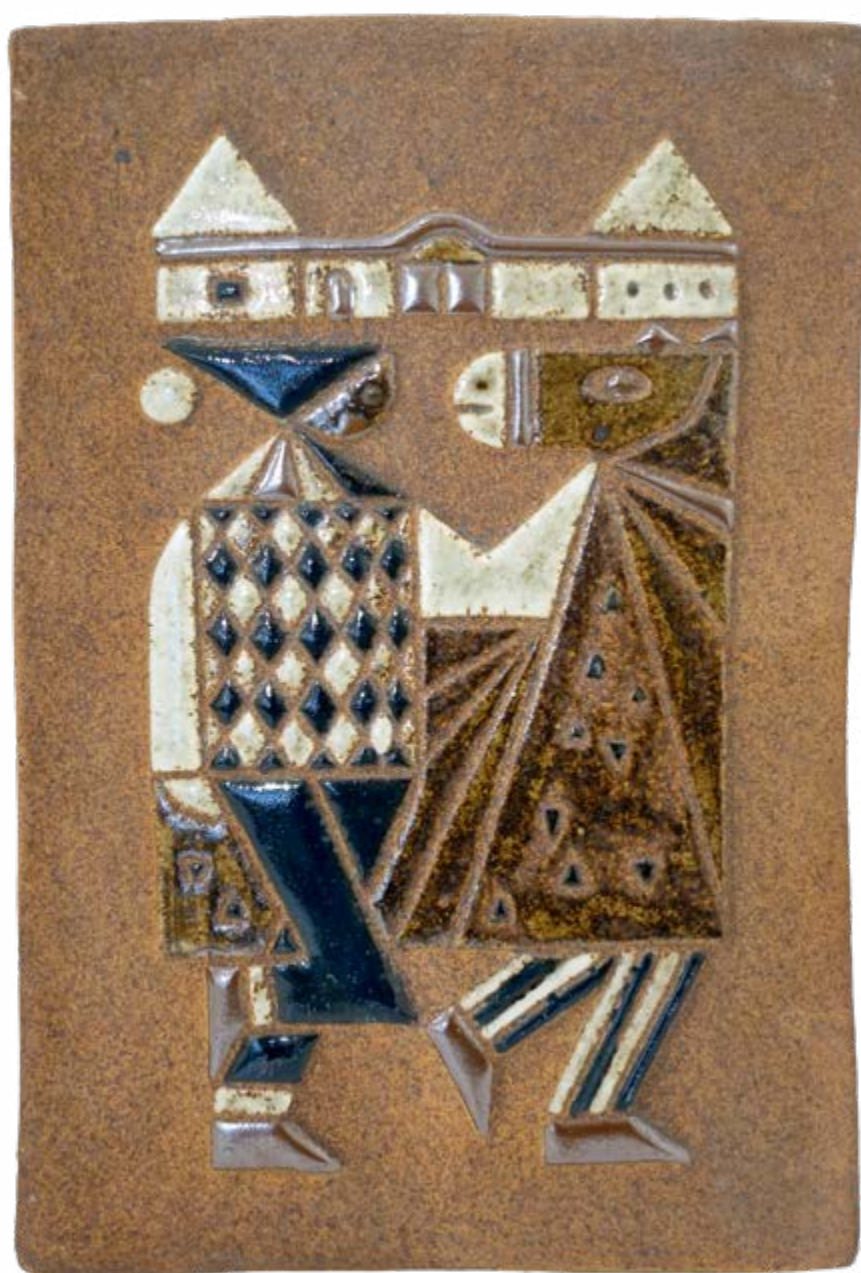
Masopust, ozdobný kachel, autor Antonín Škoda, 1962, 35 x 19 cm, vytvořeno formováním z hrnčířské hmoty, Městské muzeum Bechyně