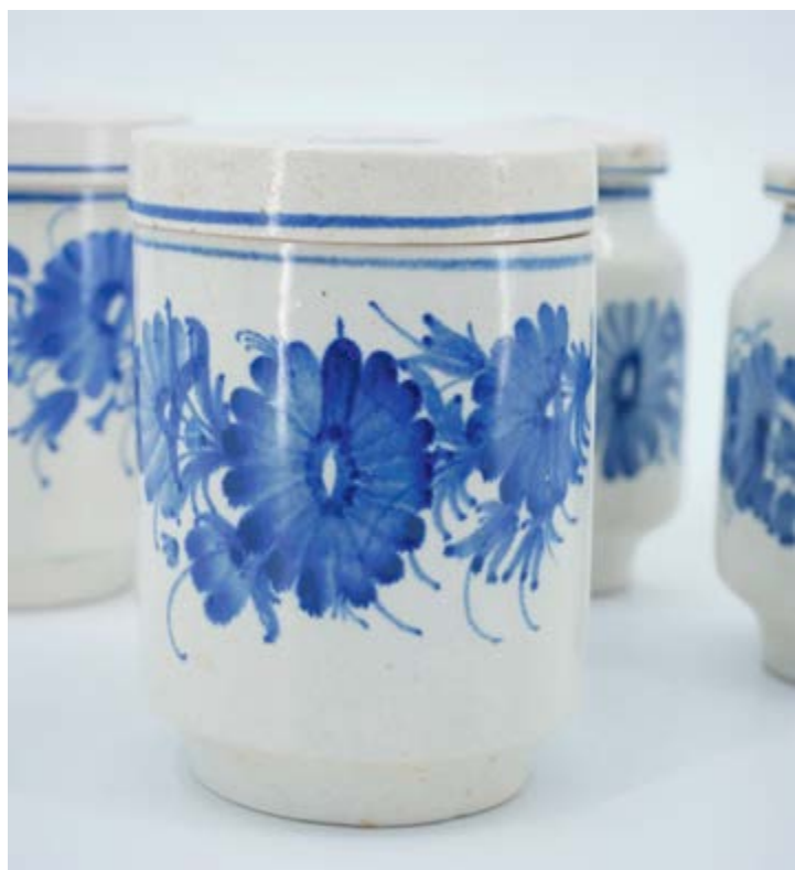
Ukázka dekoru typu „modrý květ“, 70. nebo 80. léta